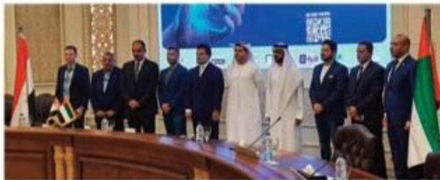
The Arabian Gulf Investments Company acquired stakes in the Egyptian Company for Embedded Systems and Industry, EasyCash for electronic payment and Health Technology for Advanced Technology and Public Health

A stake was acquired in EasyCash for electronic payment,